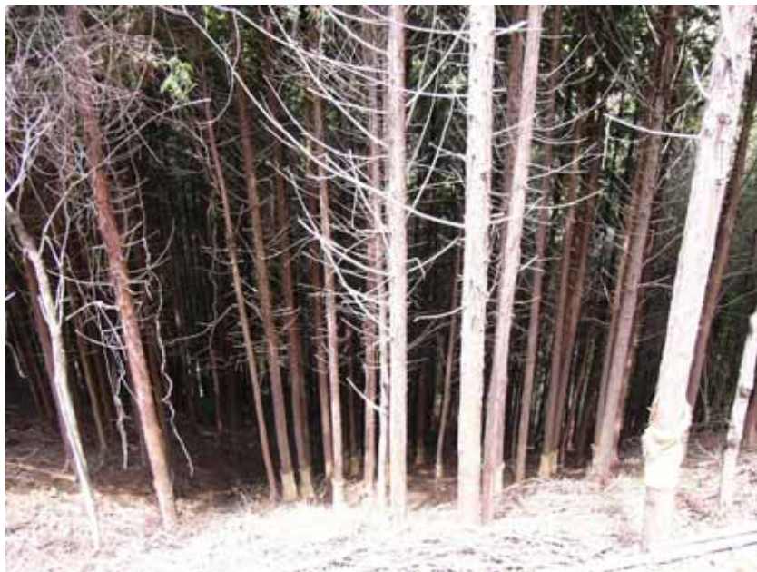
利用区域内の要間伐森林の状況