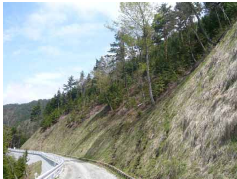
整備済みの林道と沿線の造林状況